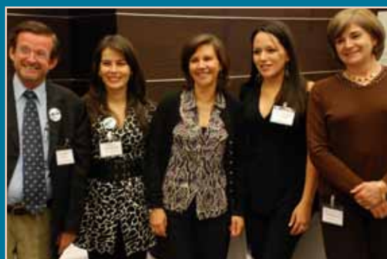
Los organizadores y participantes de la Universidad Panamericana, de Cuenca

Profesores de las 9 universidades que han formado una red creada para mantener activo el tema de buen gobierno en la mesa de educación, fueron los primeros en conocer los dos primeros estudios sobre empresas que han adoptado gobierno corporativo. Se trata de estudios sobre el proceso que siguieron las empresas Gestor Inc. y la Cooperativa de Ahorro y Crédito El Sagrario, las dos primeras en el Ecuador que adoptaron códigos para el mejor gobierno de las empresas, con el apoyo del Programa de Buen Gobierno Corporativo del Ecuador. Este estudio está disponible en las oficinas del programa y muy pronto también podrá descargarse en www.gobiernocorporativo.com.ec .