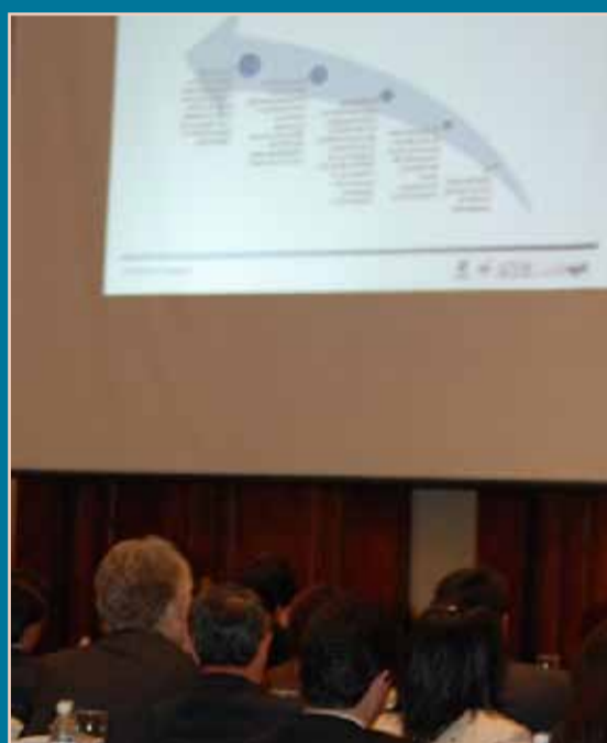
Dos momentos de los encuentros "Gobierno Corporativo en el Ecuador: el éxito en los procesos de implementación"

el Ecuador: el éxito en los procesos de implementación" fue más que un foro: se marca, a partir de allí, el inicio de una discusión abierta, nacional y fundamental, que se ha convertido ya en un hito dentro de la vida empresarial del país.