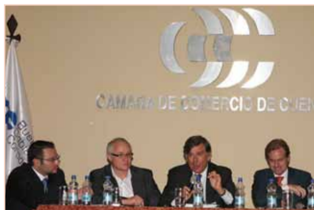
El gobierno corporativo, cada vez con más fuerza, se considera un aspecto fundamental de la organización interna

El proceso se cumple paso a paso; este es un programa sólido en la metodología y cuyos resultados ya son visibles.