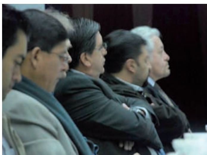
Algunos miembros de la Cámara de la Pequeña Industria de Pichincha (Capeipi) participaron en el taller de gobierno corporativo