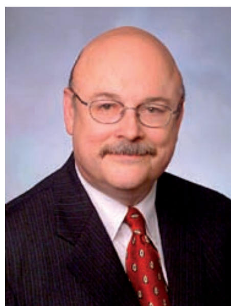
El director ejecutivo del CIPE (Centre for International Private Enterprise) John Sullivan

medios de comunicación; todos desempeñan papeles importantes en este proceso de cambio, especialmente en el contexto de los mercados emergentes. Como un ejemplo concreto, de las 6.000 empresas que están adoptando sostenibles