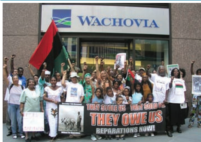
Clientes de uno de los más tradicionales bancos de Estados Unidos protestan frente a una de las sucursales

Ahora, ¿nadie sabía que esto pasaba? Si se dejan de lado los controles gubernamentales, es justo preguntarse si había accionistas que tenían conocimiento que su patrimonio se era en ese momento la única bala de una ruleta rusa